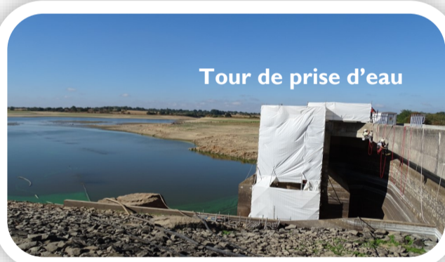
Tour de prise d'eau

Les lots de travaux du barrage sont tous engagés. Trois entreprises sont présentes et opèrent sur le béton , les évacuateurs de crues et la tour de prise d'eau .