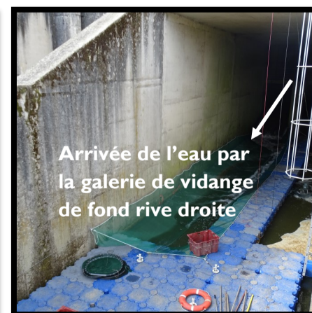
Arrivée de l'eau par la galerie de vidange de fond rive droite