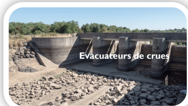
Evacuateurs de crues

Les lots de travaux du barrage sont tous engagés. Trois entreprises sont présentes et opèrent sur le béton , les évacuateurs de crues et la tour de prise d'eau .