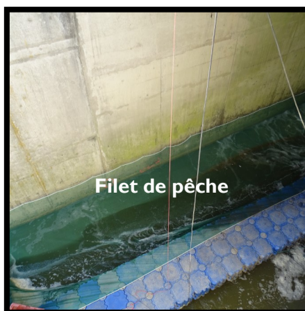
Filet de pêche